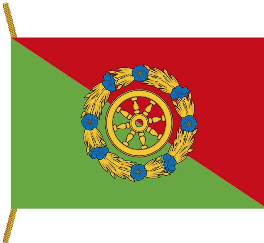
РИСУНОК ФЛАГА МУНИЦИПАЛЬНОГО ОКРУГА СЕВЕРНОЕ ИЗМАЙЛОВО В ГОРОДЕ МОСКВЕ (лицевая сторона)

Приложение к Положению «О флаге муниципального округа Северное Измайлово в городе Москве»